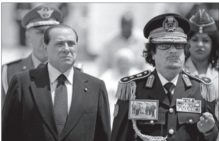
Itaalia valitsusjuht Silvio Berlusconi koos Kaddafiga tolle Itaalia-visiidi ajal 2009. aasta juunis

On olemas vaid üht liiki terrorism – riiklik terrorism. Ükski terrorirühmitus ei suudaks olemas olla, kui teda ei toetaks mingi riik. Ja praegusel hetkel ei ole ühelgi Liibüat ründaval riigil õigust visata esimene kivi, vastates süüdistus- tele, mida nad ise on õhku loopinud, püüdes õigustada järjekordset tapatal- gut ja ühe diktaatori asendamist teisega.