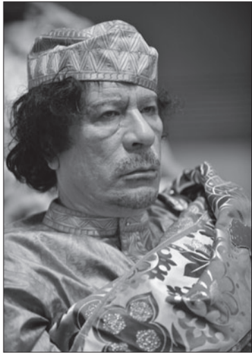
Liibüa juht Muammar Kaddafi

Liibüa on riik, mis on saanud oma nime Aafrika mandri iidse nime järgi. Vanad kreeklased andsid maale, mis neist lõunas ja kohe peale suurt merd asus, nimeks LIBIA. Siis tulid roomlased ja hakkasid tollal tuntutest kolmandat suuremat maamassi kutsu- ma Aafrikaks.