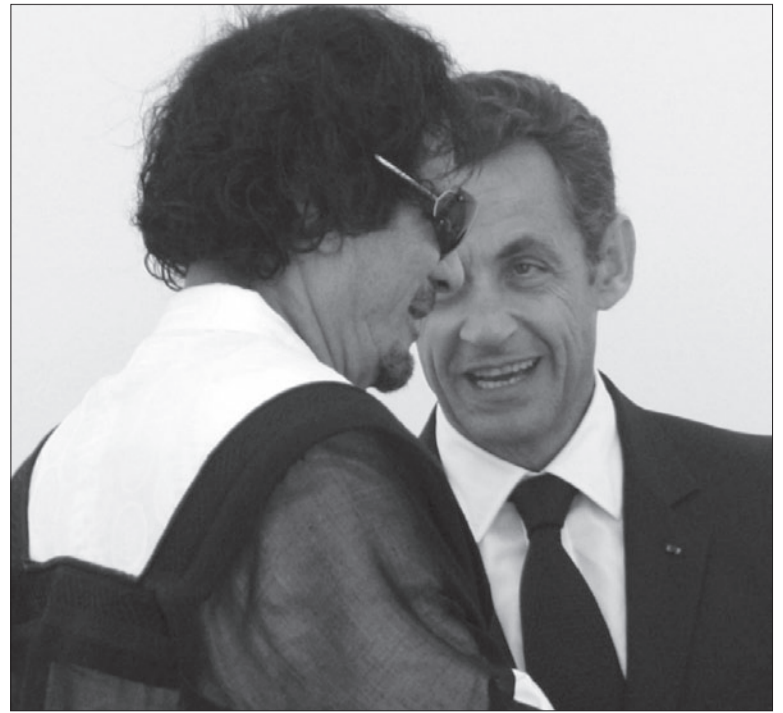
Kaddafi ja Prantsuse president N. Sarkozy – kas vaid rahvuskaaslased või koguni sugulased?

Kaddafi juured ei ole jätanud teda hätta ega ka eemale maailmapoliitikast. Lockerbie lennuõnnetus ehk siis terroriakt peaks meenuma paljudele. Seal süüdistati ühte liibüalast, kes olevat selle pommi valmistanud ja ka lennukisse viinud. Samas aga selgus teises kohtuprotsessis, mille algatasid rünnaku hukkunud inimeste lähedased, et see liibüalane oli lihtsalt ettur suures mängus. Mees oli selle rünnakuga osaliselt küll seotud, aga